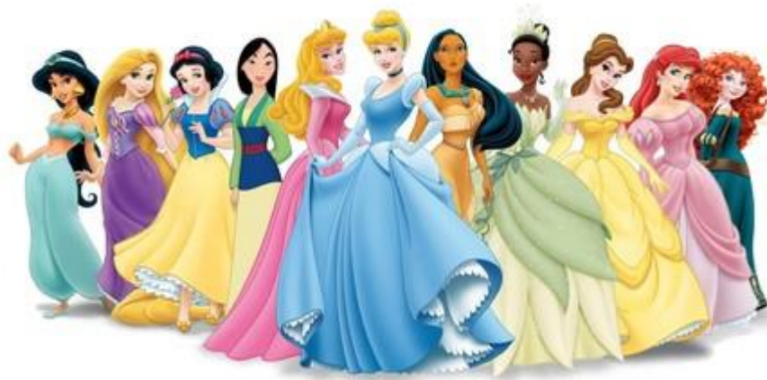
Figura 1. Elenco de Princesas Disney.

El arquetipo del personaje femenino dentro del universo de la gran factoría de fantasía: una joven, bella, esbelta, delicada que se opone a aceptar su destino. [...] subordinada a la existencia de una figura masculina, directamente relacionado con el estereotipado príncipe azul