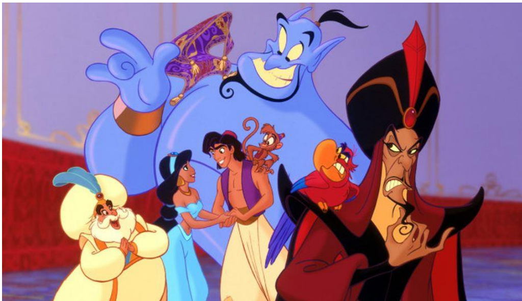
Figura 2: Fotograma de los personajes de “Aladdín”

Además de esa adscripción al ámbito doméstico, podemos ver por ejemplo estereotipos raciales en princesas como Jasmine (Aladdin) la cual es de origen árabe, pero que en comparación al resto de personajes del filme, apareciendo representados con labios carnosos, narices ganchudas y ceños muy definidos no posee ni un solo rasgo característico de esta raza, solo una piel bronceada, ni tan siquiera oscura.