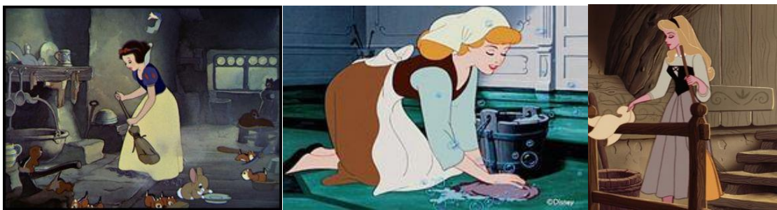
Figura 5: Fotogramas de Blancanieves, Cenicienta y Aurora.

Viéndose también profundamente adscritas, como podemos observar en estas imágenes de los largometrajes, al ámbito privado y el trabajo doméstico, estableciendo otro fuerte estereotipo de las protagonistas femeninas de Disney; pero ¿Ocurre esto en todas las princesas Disney?