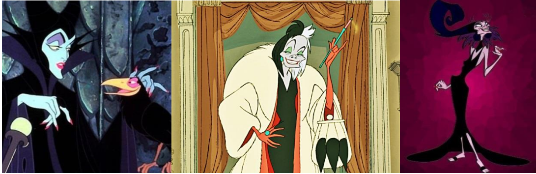
Figura 11: Fotogramas de algunas villanas Disney.