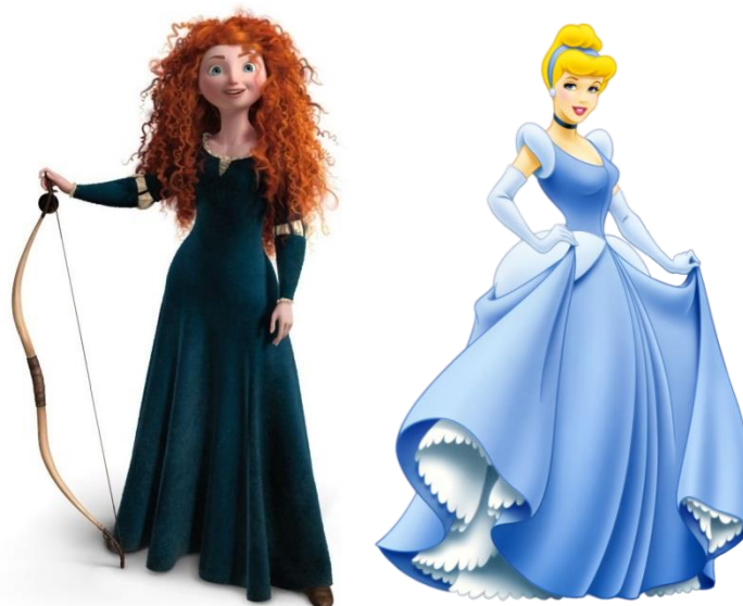
Figura 6: Fotografía de Mérida y Cenicienta.

La respuesta a esto llega de la mano de Mérida (Brave) con la que se comienzan a apartar ligeramente los estereotipos de las primeras princesas, presentando como vemos en la siguiente figura, una muchacha bella, pero de proporciones infantiles y poco sexualizadas, luciendo una imperfecta melena alborotada y un vestido simple y cómodo, alejándose de los tradicionales y pomposos atavíos de sus compañeras, además de utilizar el arco como arma, que en lugar de ser un símbolo ligado al espacio doméstico, como es en el caso de Rapunzel, aquí el arco remite a las Amazonas de la mitología clásica.