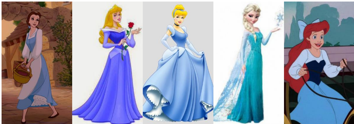
Figura 8: Algunas de las princesas con atuendos azules.

Hay muchos aspectos positivos del color azul, connotaciones maravillosas como la constancia y la habilidad de sobreponerse de los tiempos oscuros. Una de las razones por las que el azul ha sido un color tradicionalmente asociado al género masculino.