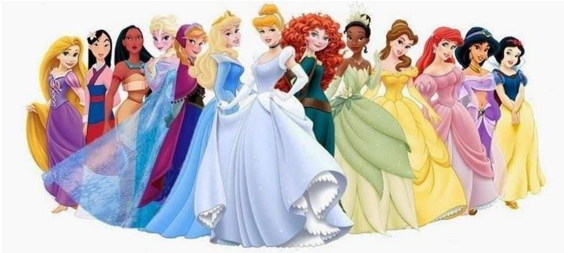
Figura 3: Integrantes del grupo Princesas Disney.

(Jasmine, Pocahontas y Tiana) siendo Tiana la única que visualmente parece pertenecer a la raza que representa.