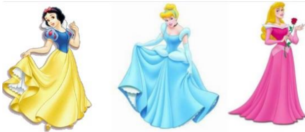
Figura 4: Similitudes entre las tres primeras princesas.