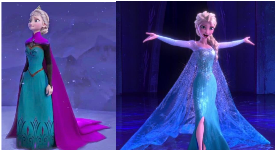
Figura 7: Fotogramas de Elsa en la película Frozen.

Siguiendo en esta línea de progresivo empoderamiento, aparecen también en la factoría Disney las hermanas Elsa y Anna (Frozen), pero al permanecer la primera de ellas encerrada en su palacio, una vez más ámbito doméstico, a causa de sus poderes mágicos, hace que aunque presente algunos atributos de las primeras princesas, como la belleza, rompe con el resto de principios al reprimir su personalidad llenándose de tristeza. Cuando descubren sus poderes y con la escena de su canción “Let it go” podemos ver cómo esta princesa se transforma por completo rompiendo con los estereotipos de sumisión, adoptando un gran empoderamiento dando rienda suelta a su magia sin dejar que nadie la controle, lo cual se puede apreciar perfectamente en cómo su expresión facial cambia a lo largo de la película desde el miedo hasta la más absoluta vivacidad; pero también cambia físicamente ya que pasa de una Elsa recatada a ofrecernos una Elsa mucho más sensual, mostrando a pesar de ese físico estereotipado, un modelo de mujer libre y empoderada.