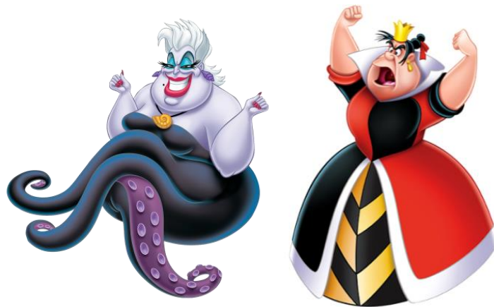
Figura 12: Villanas de Disney.

Como se puede observar, nuestras heroínas Disney han ido cambiando, pasando de mostrar una mujer claramente encorsetada en la belleza, la inocencia y el hogar que espera al amor verdadero, para abrir paso a jovencitas empoderadas que salen al mundo en busca de aventuras siendo capaces de blandir armas y esgrimir magia, pero ¿Es la factoría Disney consciente de los estereotipos que sus personajes portan y a lo largo de la historia han mostrado a tantos niños y niñas?