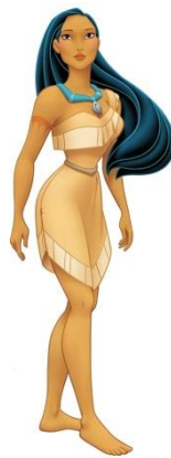
Figura 10: Pocahontas

En algunas ocasiones el azul no ha estado directamente presente en sus vestidos, sino en accesorios, como pueden ser el colgante de Pocahontas.