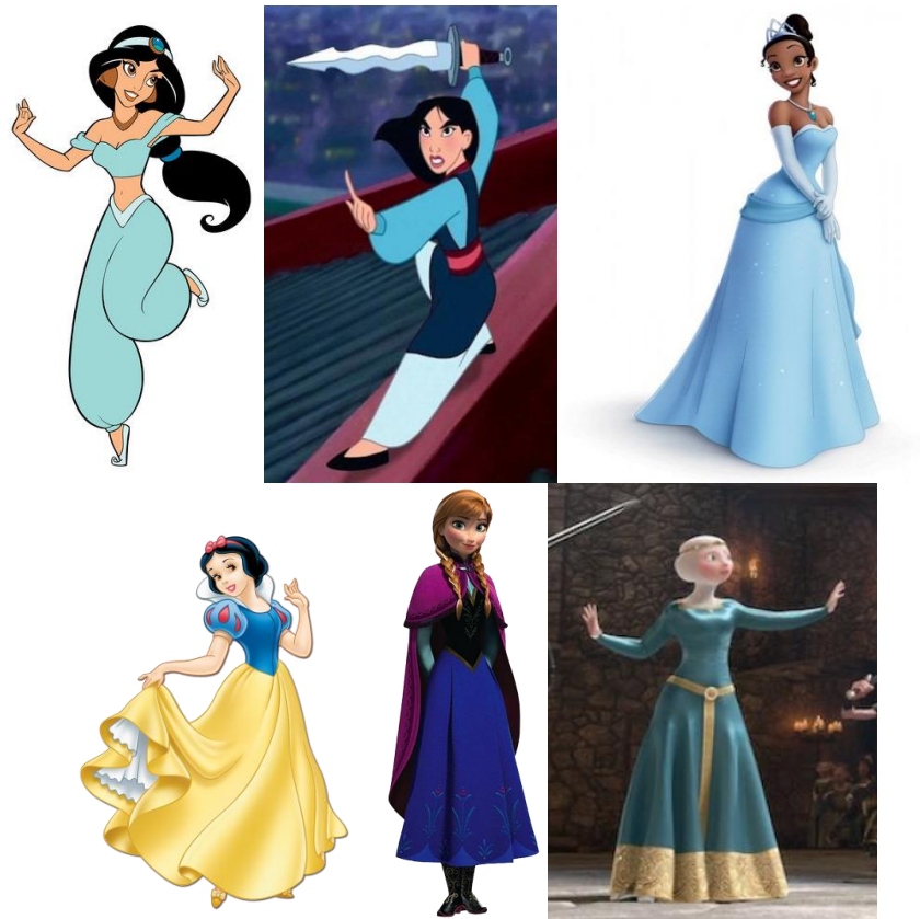
Figura 9: Fotografías de diversas princesas Disney. Fuente elaboración propia a partir de imágenes de Internet

En algunas ocasiones el azul no ha estado directamente presente en sus vestidos, sino en accesorios, como pueden ser el colgante de Pocahontas.